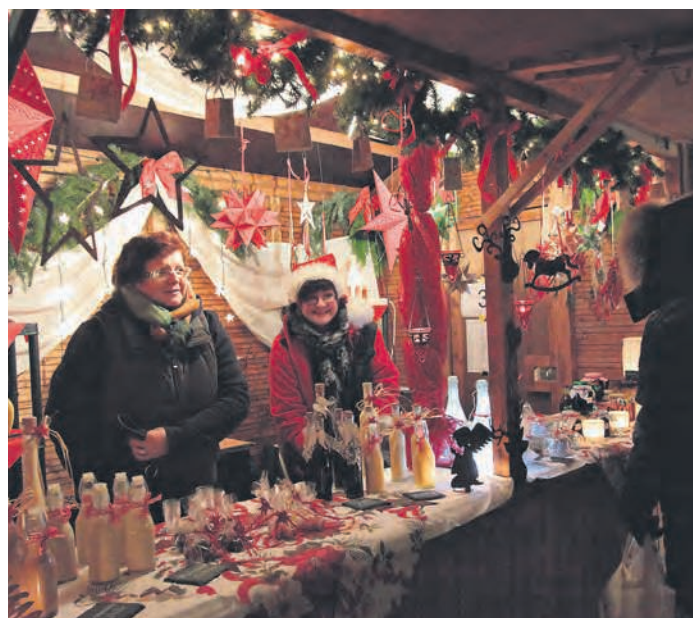
Ein qualitativ hochwertiges Sortiment bieten die Aussteller auf dem Straelener Weihnachtsmarkt am kommenden Wochenende.

Straelen · de-Cabanes-Straße · Tel. 02834-944599 · Homepage: www.gefluegelhof-berghs.de Öffnungszeiten: Mo.-Fr. 8.00-18.30 Uhr, Sa. 8.00-13.30 Uhr