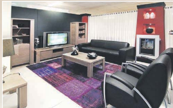
Fotos von originalen Ausstellungsstücken, zu sehen in unserem Haus.