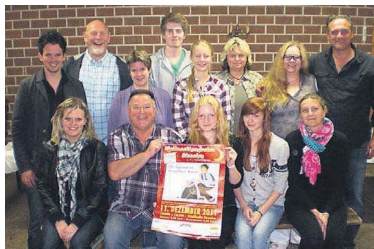
Das Ensemble des Weihnachtsmärchens freut sich auf die Premiere.

Auf insgesamt sieben Spielorten, auf der großen Bühne, im Saal und mitten im Publikum, soll dieser Klassiker der Brüder Grimm den Rahmen und die Ausstattung aller vorangegangenen Aufführungen überflügeln. Eine romantische Wassermühle, de-